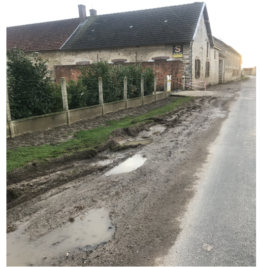
Dégâts constatés rue de Bouchy au niveau du croisement avec le Chemin des Louans courant janvier 2020.