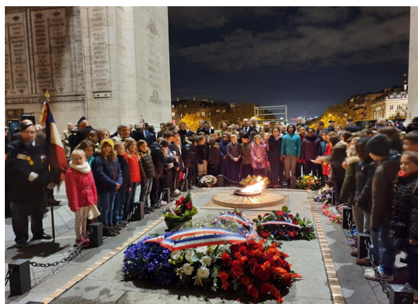
Cérémonie du ravivage de la flamme au pied de l'Arc de Triomphe à Paris 8 novembre 2019